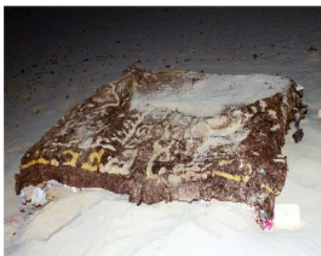
Күйібен жабылған ағаш қақпақ.

Дүзген, көкбұта құдықтардың суы тал түсте күн қатты ысығанша тартылып кететін, түн асқанша қайта өнетін таяз