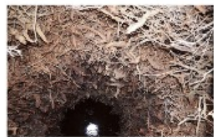
Көкбұта шегеннің қабырғасы

түрлеріне қатысты қолданылатын жердікті анау — бекке құдық. Казіргі таңда грунт суы төмендеп кетуіне байланысты бекке құдықтар өте сирек кездеседі. Дүзген, көкбұта құдықтардың қандай түрі болмасын, жергілікті жерде «табандық» деп аталатын ойпаттау жерлер қазылады. Табандық — бағалды, ұлағат жақын, тұщы су шығатын ылданду, ойпаттау жер. Әрі құдық қазу үшін табандықтан иі, қиық өскен жер таңдалады.