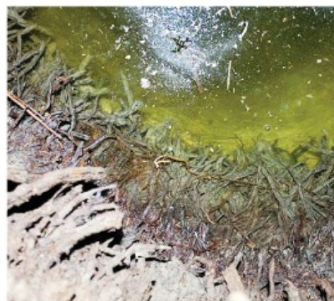
Көкбұтамен шегенделген құдық. Көкбұта шегеннің түбі.

Дүзген, көкбұтамен құдық өрнеуін де шығарып, аузын ағаш қақпақпен немесе күйібен қапталған ағаш қақпақпен жабады. Ағаш қақпақтың сыртынан киіз жабу, қатпау құдық суын құм, шаң тозынан сақтау үшін қолданылады.