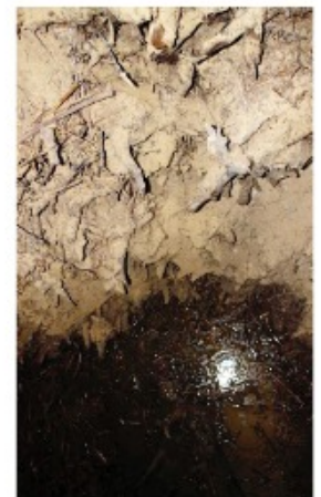
Бір ғасырдай қызмет өткен ауыстыруды қажет ететін, отырған көне дүзген шеген.

Аралдың солтүстігіндегі осы құмды алқаптарда шеген салудың халықтық білімін аталан балаға мұра етіп сақтап отырған, қолдағы малын суаруға шеген құдықты қолданатын ағайымды әлі кездестіруге болады. Құдық суы тарқан сайын оны береді. Дүзген мен көкбұта шегеннің табиғи сүзгісінен өткен құдықтың мол суы 100 жылқыны бір уақытта суаруға жетеді. Бұл өңірде суы мол, тез өнетін құдықты қарағаз құдық деп атау қалыптасқан.