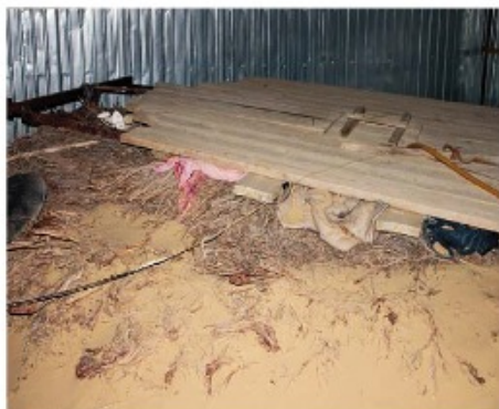
Көкбұтамен көмкерілген құдық аузы.

түрлеріне қатысты қолданылатын жердікті анау — бекке құдық. Казіргі таңда грунт суы төмендеп кетуіне байланысты бекке құдықтар өте сирек кездеседі. Дүзген, көкбұта құдықтардың қандай түрі болмасын, жергілікті жерде «табандық» деп аталатын ойпаттау жерлер қазылады. Табандық — бағалды, ұлағат жақын, тұщы су шығатын ылданду, ойпаттау жер. Әрі құдық қазу үшін табандықтан иі, қиық өскен жер таңдалады.