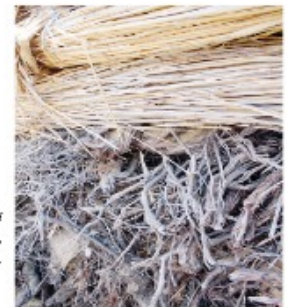
Қабырғасы көкбұта, үсті қамыс шеген.

Дүзгенмен, көкбұтамен шегенделген құдықтың үстіңгі бетін көкқасқа, шағыр, баалыш, қамыс, шеген, қоянсуейекпен көтеру кездеседі. Шеген үстіңгі өсімдіктердің бұл түрін қолдану арқылы құдық ішіне таза ауа отуы, әрі шеген арасына үстіңгі жалқан топырақтың суып түспеуін қамтамасыз еткен. Әсіресе, шағырды шегенге қосу, құдық суының қасиетін, пайдалылығын арттыра түсетінін қариялар айтып отырады. Шағыр ( Bergenia ) – тасжартаңдар тұқымдасына жататын өсімдік. Қазақстанда 2 түрі кездеседі. Соның бірі – ежазырақ шағыр немесе шағыршай ( B. crassifolia ). Биіктігі 5 – 50 см. Жапырағын қайнатып шай орнына ішеді, тұнбасынан қара, қоныр бояу алынады. Көкқасқа бетеге тұқымдас. Ал, қоянсуейек құмды жерге өсетін тікенді, оныңық өсімдік, тері бояуға да пайдаланады. Екеуі де түйе сүйіп жейтін шөп. Шегенде осы өсімдіктердің қосылуы түйе малын суарумен де байланысты.