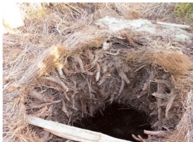
Қабырғасы дүзген, үсті шағыр шеген.

Аралдың солтүстігіндегі осы құмды алқаптарда шеген салудың халықтық білімін аталан балаға мұра етіп сақтап отырған, қолдағы малын суаруға шеген құдықты қолданатын ағайымды әлі кездестіруге болады. Құдық суы тарқан сайын оны береді. Дүзген мен көкбұта шегеннің табиғи сүзгісінен өткен құдықтың мол суы 100 жылқыны бір уақытта суаруға жетеді. Бұл өңірде суы мол, тез өнетін құдықты қарағаз құдық деп атау қалыптасқан.