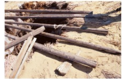
Астыңғы бөлігі дүзген, жоғарғы қабырғасы көкбұта, үсті қамыс шеген.

Құмды өңірде астыңғы шегені дүзген, үстіңгі шегені көкбұта, ал жоғарғы бөлігін қамыс шомдарын қалаған үш деңгейлі шеген құдықтар да кездеседі. Қамыс шом екі қатарлы құрайды, бірінші қатарында көлденееннен қиыластырса, үстіңгі, ең жоғарғы бөлігіне айнала ұзыншап, бір-біріне жапсарлата қаланады.